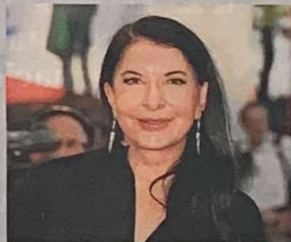
L'artista sèrbia Marina Abramovic.

Abramovic va consolidar la performance dins els cercles més elitistes de l'art però també l'ha portat als més populars. En els últims anys la seva fama la precedeix com a una celebrity : ha col·laborat amb Lady Gaga, Jay-Z i James Franco, amb Bob Wilson va simular la seva mort en una òpera i ha fet peces de body art . Però també va guanyar el Lleó d'Or a Venècia el 2017, ha dirigit òpera i la Royal Academy of Arts li dedicarà una retrospectiva el 2023.