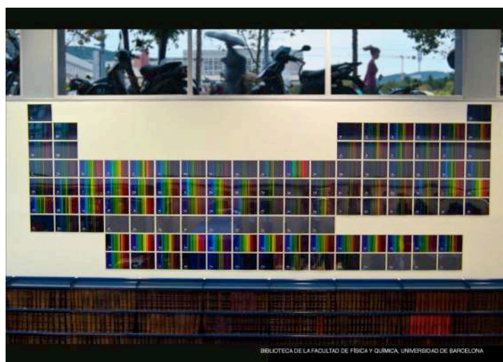
HOMENATGE ALS ELEMENTS a la Biblioteca de la Facultat de Física i Química, UB, 2019