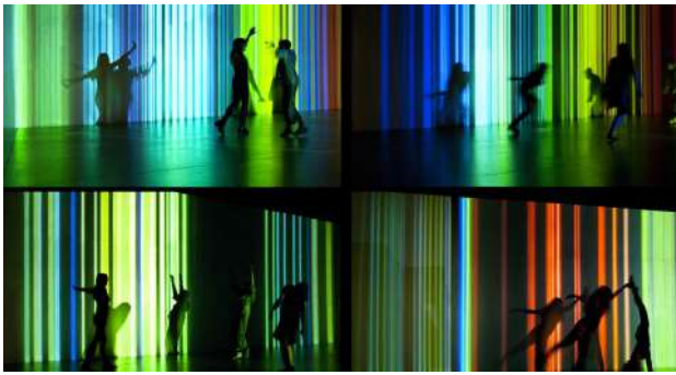
La instal·lació FREQUÈNCIES al Centro Nacional de les Artes, (CENART) a Ciutat de Mèxic, 2015