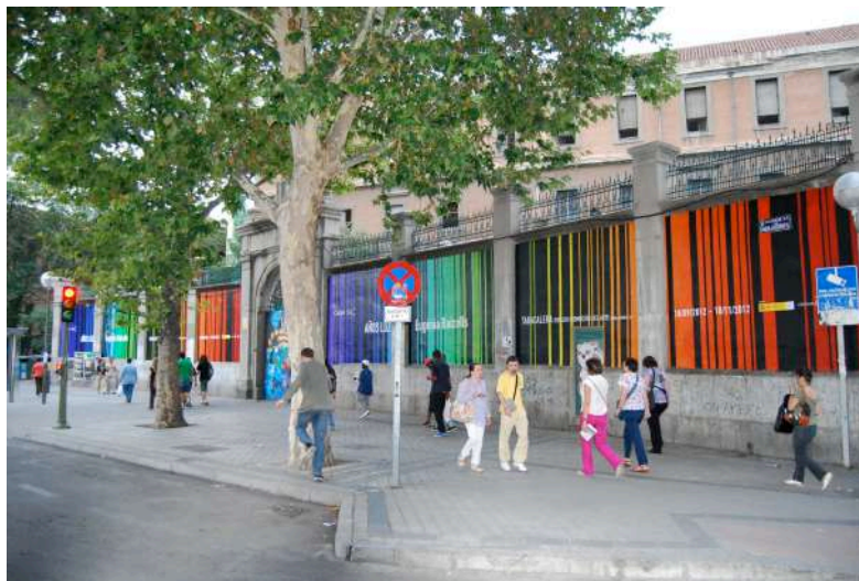
Imatges de l'espectre del coure a la plaça Glorieta de Embajadores a Madrid l'any 2012.

Eugènia Balcells, que té la llum com a centre indiscutible de la seva obra, amb el mural HOMENATGE ALS ELEMENTS posa a l'abast de tothom el seu reconeixement per aquestes combinacions lumíniques que reflecteixen la matèria i que ens permeten pensar que cadascú de nosaltres som també subjectes que incloem en nosaltres múltiples freqüències de llum.