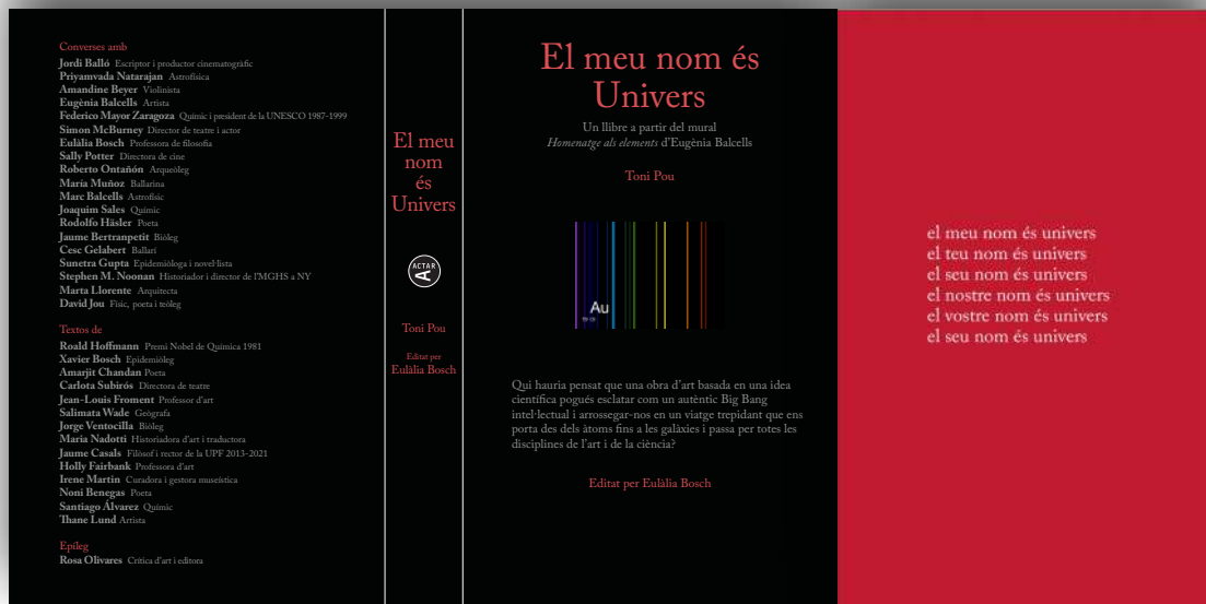
EL MEU NOM ÉS UNIVERS : Coberta, contracoberta i darrera pàgina.