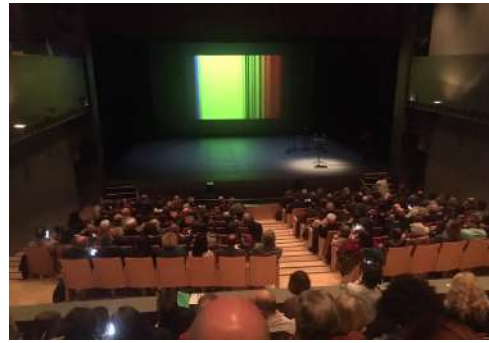
Acte inaugural de l'Any Internacional de la Taula Periòdica. Barcelona, 2019

El mural acompanya la instal·lació FREQUÈNCIES on els espectres dels elements es troben i es combinen entre ells davant dels ulls dels espectadors, constituint una metàfora de la creació de l'univers.