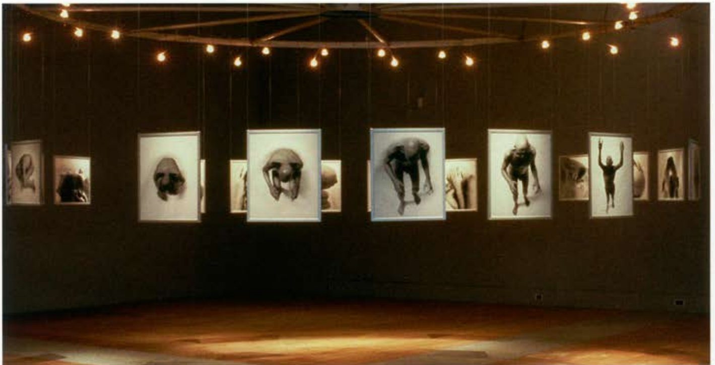
Descansen como en la casa materna, 1993.