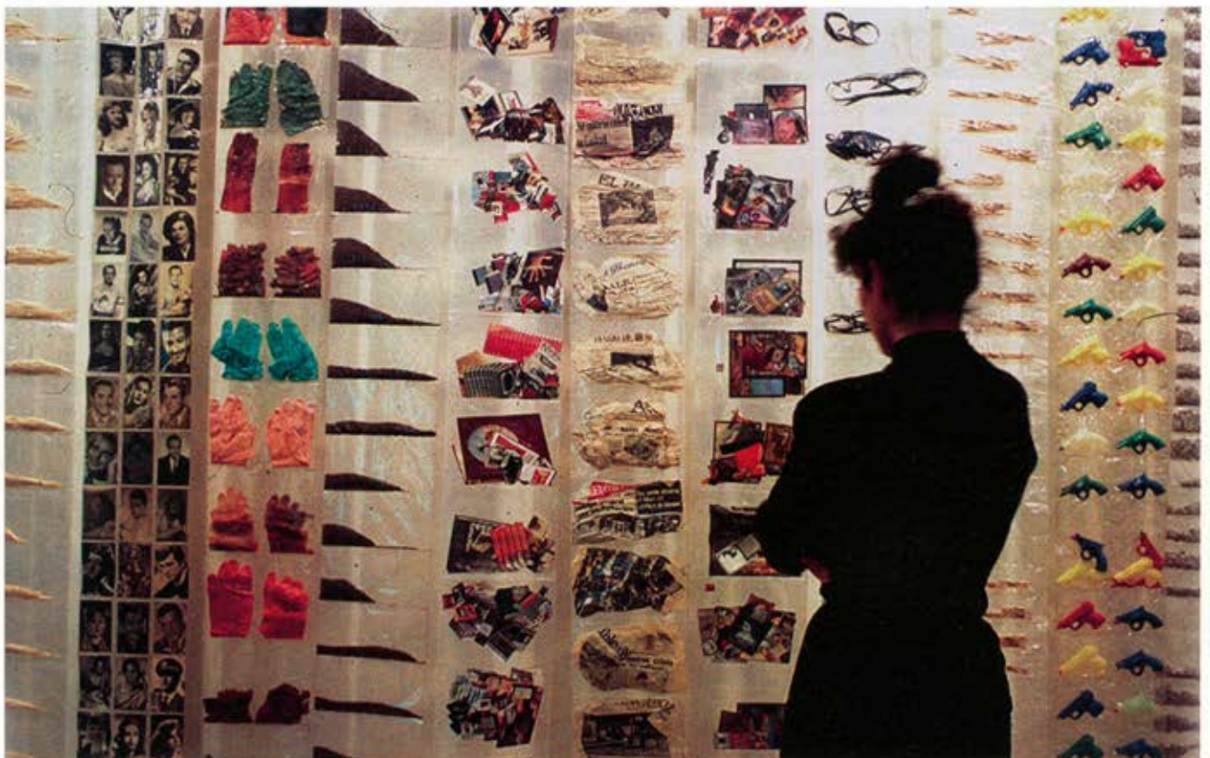
Supermercart , 1976.