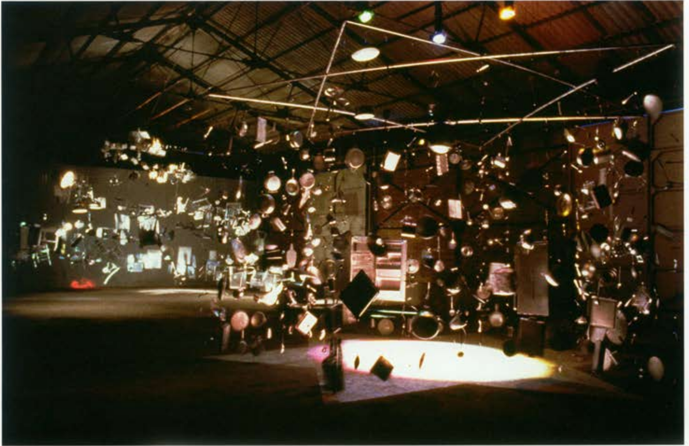
En el cor de les coses, 1998.