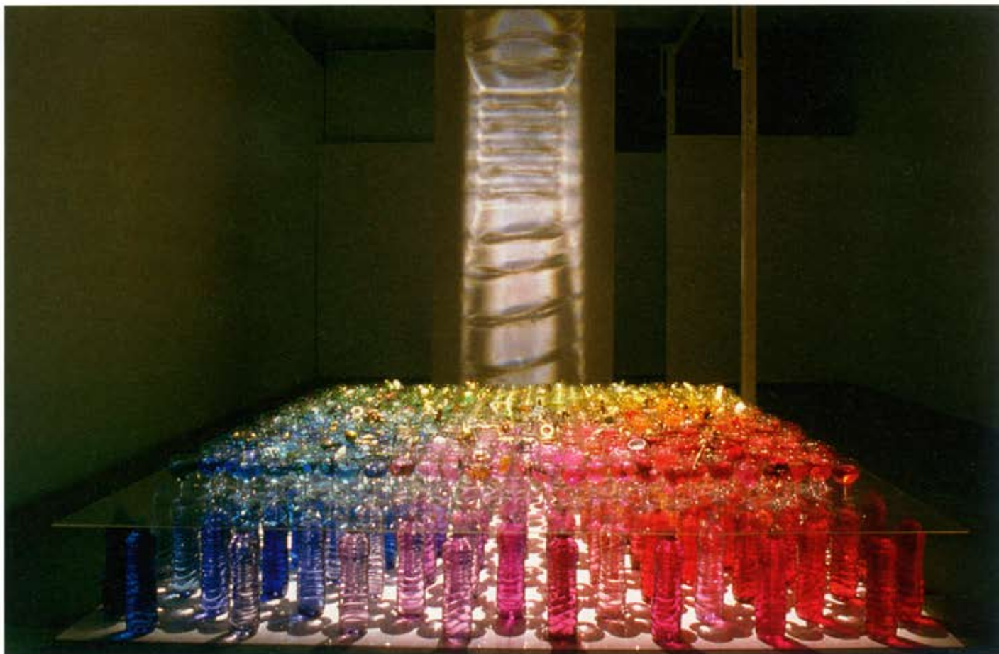
Brindis (Invitación a la abundancia), 1999.