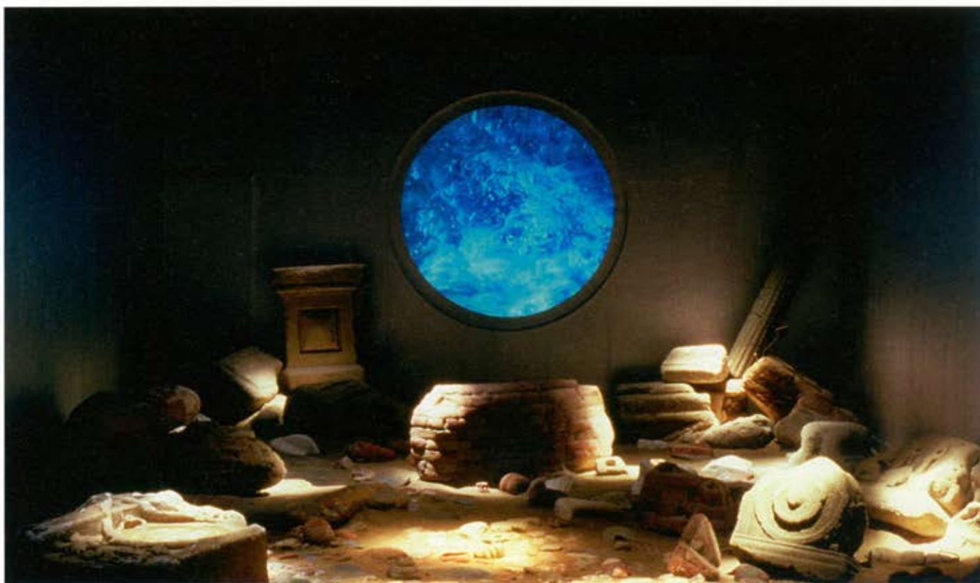
Exposure Time, 1989.