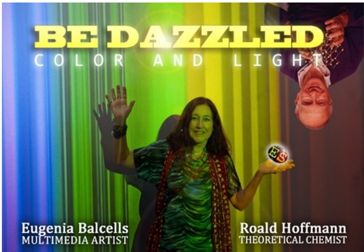
Poster del espectáculo de Eugenia Balcells con Roald Hoffman en New York el 3-9-2017 en el Cornelia Street Café, NY

El concepto que titula el conjunto de obras LA LUZ ES LA VOZ DE LA MATERIA nace de una intuición de la artista Eugenia Balcells conversando con Roald Hoffman, premio Nobel de Química, en el taller de la artista en New York en el año 2017 mientras hacían un recorrido por varias instalaciones de la artista relacionadas con la luz.