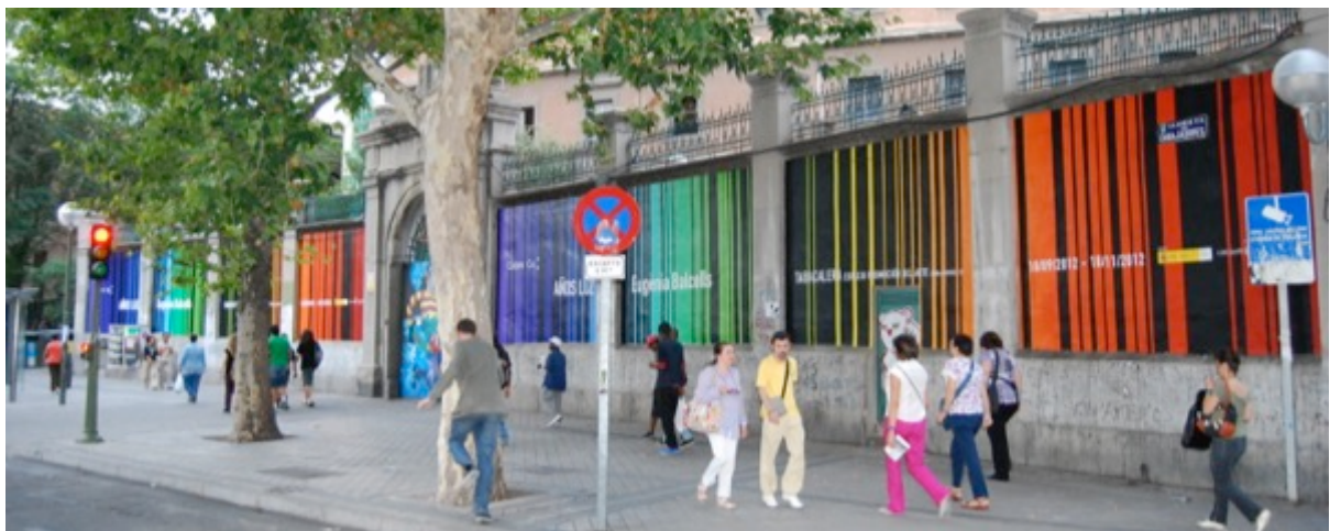
Espectro de emisión del cobre en Glorieta de Embajadores, Madrid 2012